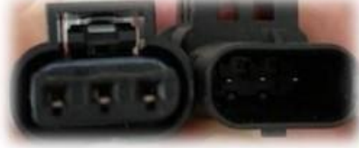
Ladedruck 3-polig digital (SENT)

Mit bis zu 3.6 Millionen Datenpaketen pro Stunde sind wir hier im Spiel. In dieser Liga wollen wir keine Konkurrenz mehr.