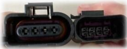
Ladedruck 4-polig analog